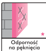
Odporność na pęknięcia